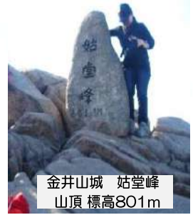
金井山城 姑堂峰 山頂 標高801m