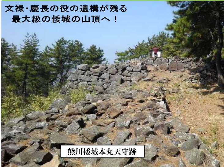
熊川倭城本丸天守跡