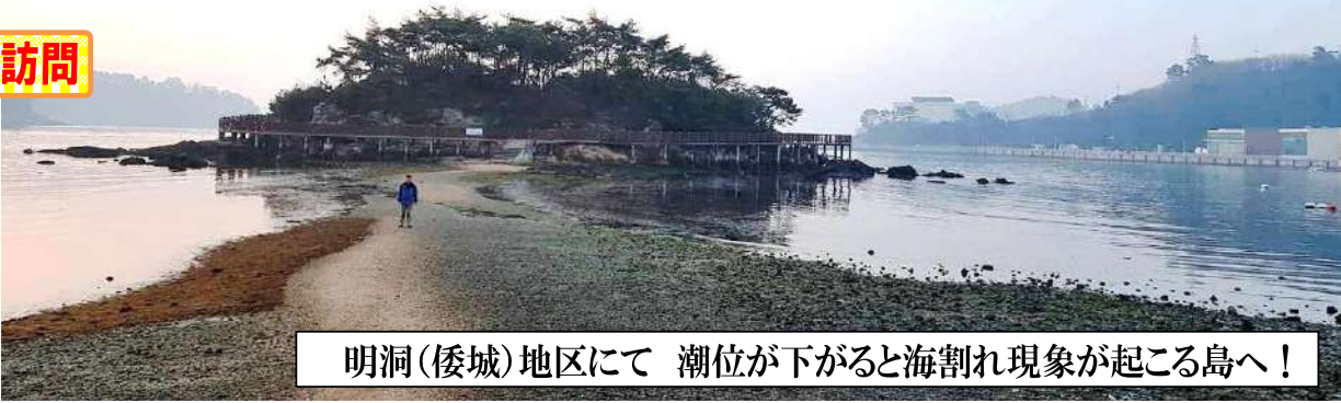
明洞(倭城)地区にて 潮位が下がると海割れ現象が起こる島へ！

現地訪問日の暦は大潮(月齢29)となっており、この地域がいに潮位の影響を受ける水の要所であるかを参加者皆様が体感することができます。