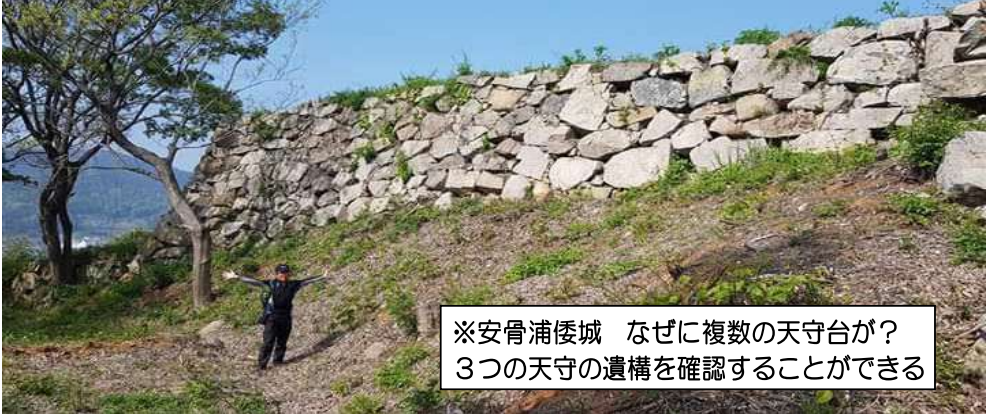
※安骨浦倭城 なぜに複数の天守台が？ 3つの天守の遺構を確認することができる

※上記、宿泊オプションお申込みの方は全4日間の行程になります。※ツアー3日目は添乗員・現地係員及び食事は付きません。お客様ご自身での行動となります。また、釜山港フェリーチェックインも、お客様ご自身で行っていただくことになります。(17:30まで)