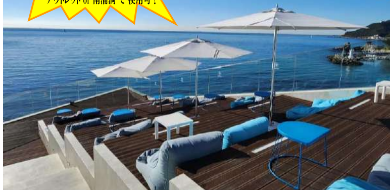
写真:松亭海岸オーシャンビュー絶景カフェ Cafe Coralani

OLIVE YOUNG 10,000 ウォン商品券！ アウトレット or 南浦洞 で使用可！