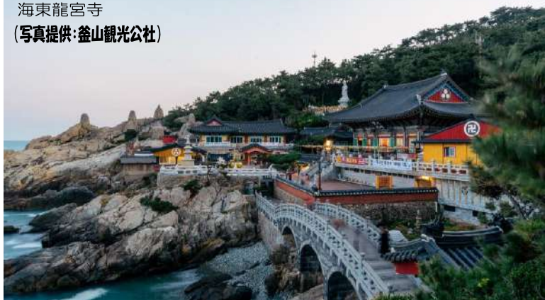
海東龍宮寺