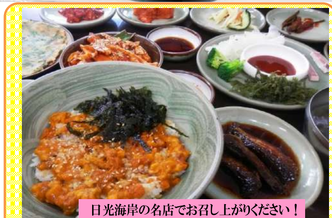
日光海岸の名店でお召し上がりください！