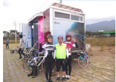
トイレはサイクリングロード途中で十分に整備されています。

ご参加の皆様の写真は次回以降の募集用パンフレット等に掲載させていただくことがあります。あらかじめご理解の程宜しくお願いします。