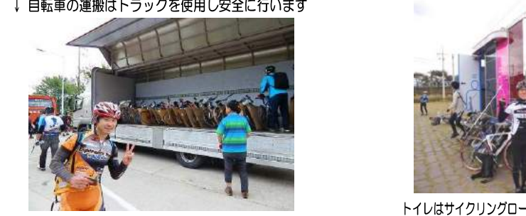
↓ 自転車の運搬はトラックを使用し安全に行います

当ツアーはパスポート(旅券)が必要ですが、未取得の方はお申込みの段階ではパスポートは不要です。お申込みいただきましてから、各自パスポートをご取得いただき、5月13日頃までに必ず、パスポート番号などを当社宛てにお知らせください。(パスポートの有効期限切れにご注意ください)